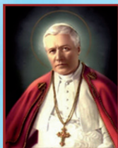
St Pius X