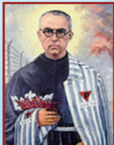
St Maximilian Kolbe