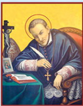
St Alphonse Ligori