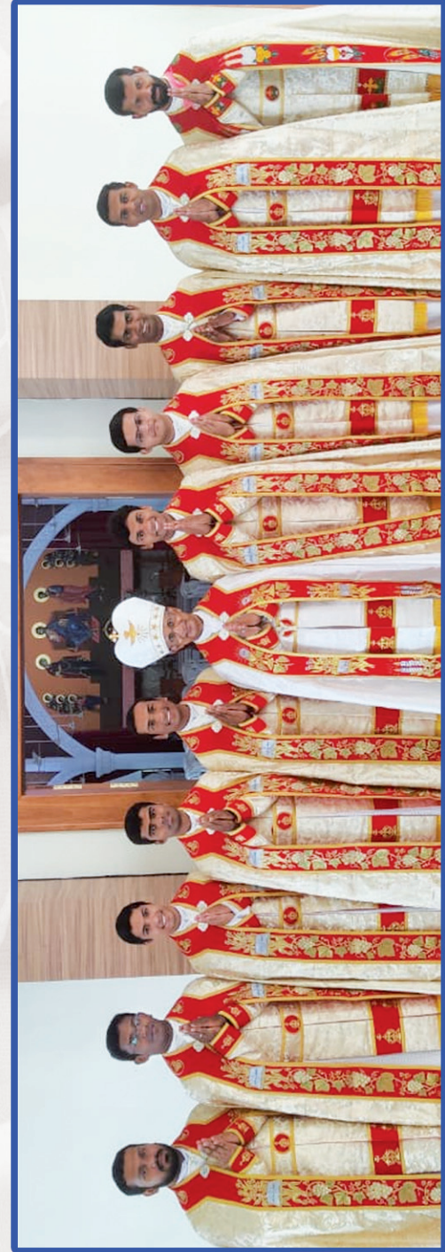
NEWLY ORDAINED PRIESTS OF THE EPARCHY WITH THE BISHOP