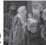
നമ്മുടെ കർത്താവിന്റെ ദേവാലയപ്രവേശനം