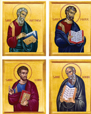
THE FOUR EVANGELISTS