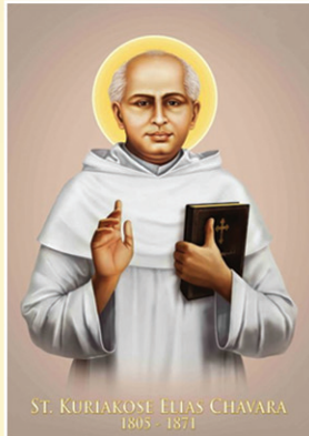
ST. KURIAKOSE ELIAS CHAVARA 1805 - 1871