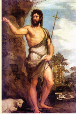
ST. JOHN THE BAPTIST