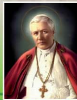
St Pius X