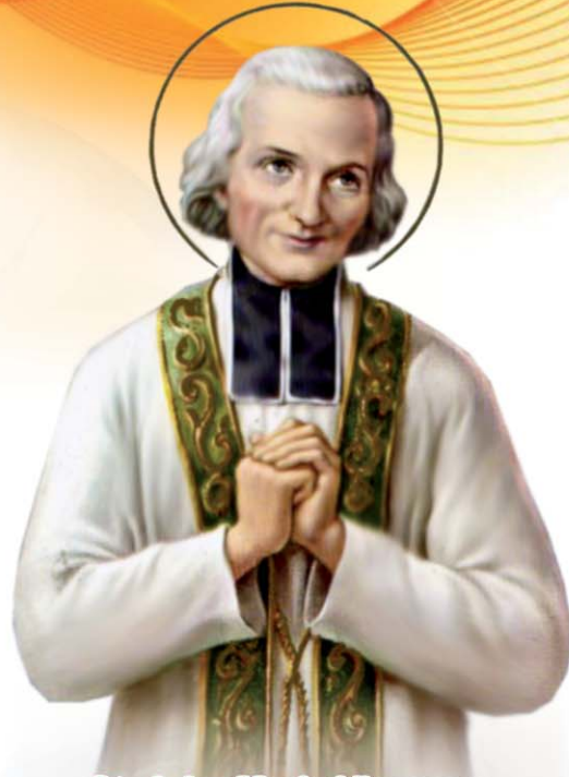
St. John Marie Vianney