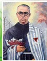
St Maximillian Kolbe