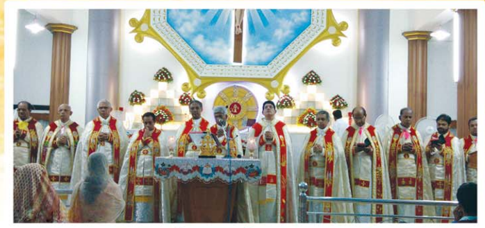
രൂപത പ്രാർത്ഥനാദിനം - വാഴക്കുളം