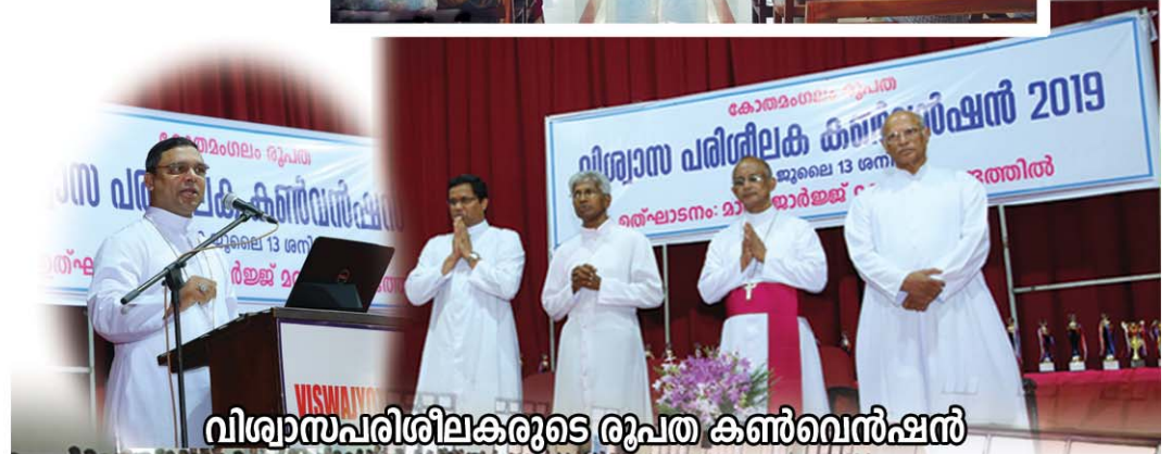
വിശ്വാസപരിശീലകരുടെ രൂപത കൺവെൻഷൻ