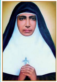
Bl. Mariam Theresa