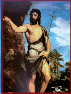
St. John the Baptist