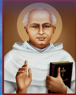
St. Chavara Kuriakose