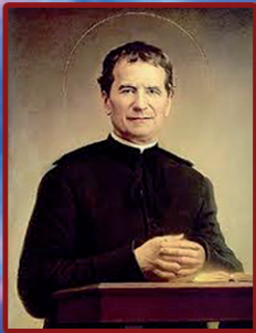
St. John Bosco