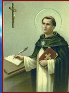
St. Thomas Aquinas