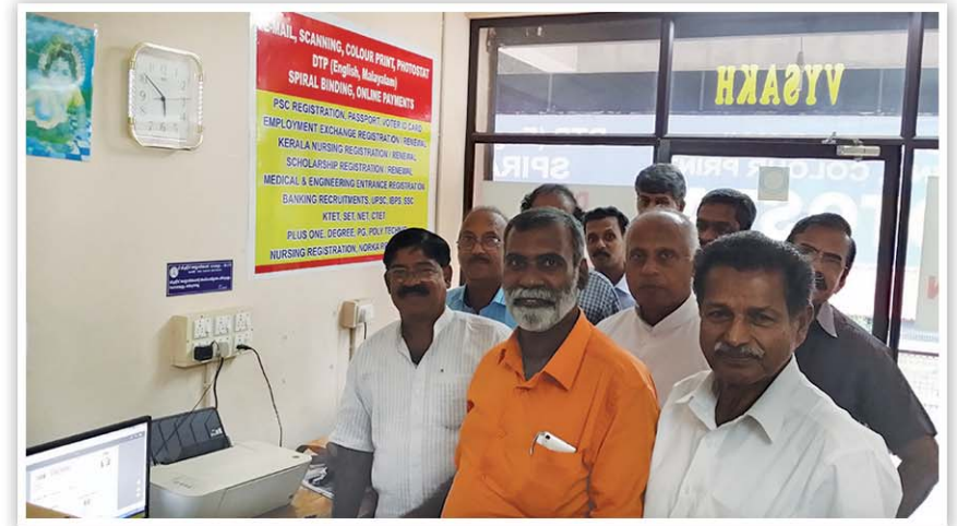
ദേശസാത്കൃത ബാങ്കുകളുടെ പകൽക്കൊള്ള അവസാനിപ്പിക്കണമെന്നാവശ്യപ്പെട്ട് ധനമന്ത്രിക്ക് ഇൻഫോ ഇ-മെയിൽ സന്ദേശം അയയ്ക്കുന്നു.