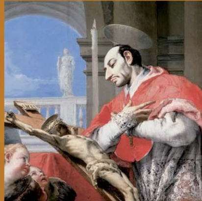
St Charles Borromeo