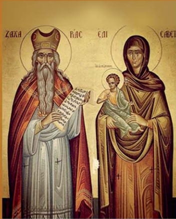
St Zechariah and St Elizabeth