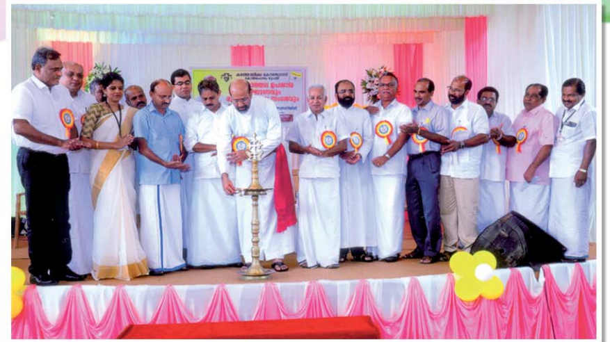
എ.കെ.സി.സി. ഉപശാഖ സംവിധാനം - സംസ്ഥാനതല ഉദ്ഘാടനം