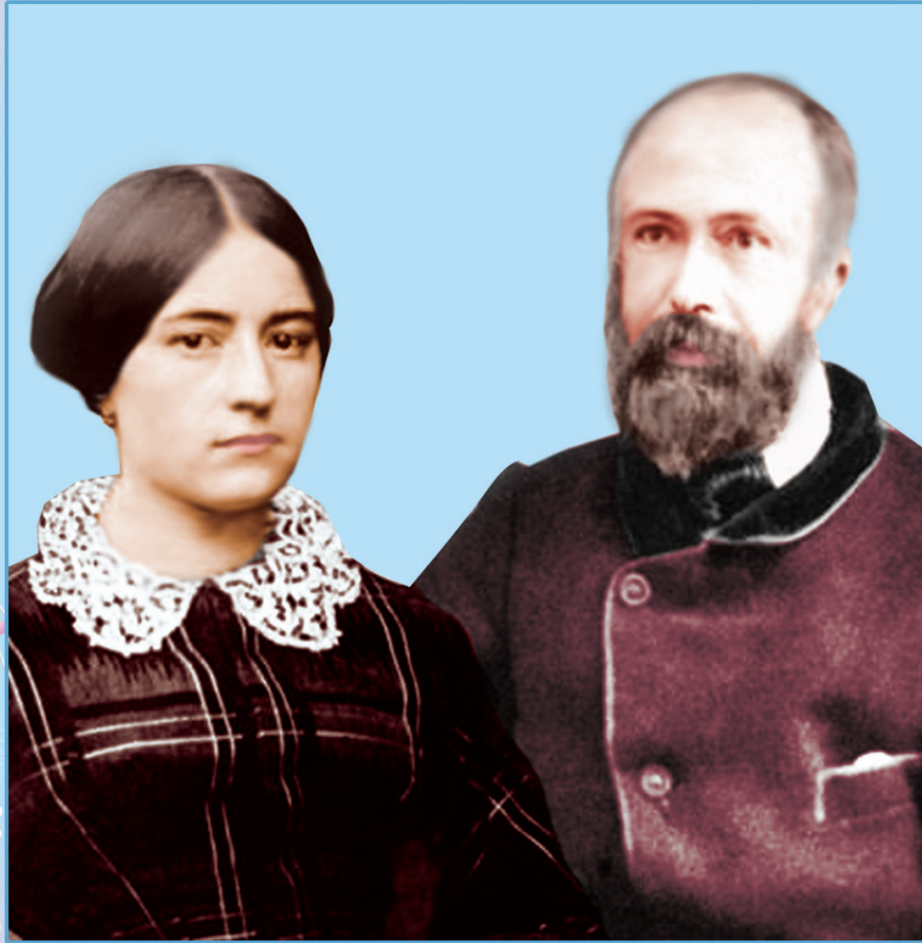
വി. ലൂയി മാർട്ടിനും വി. സേലി മാർട്ടിനും