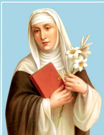
St. Catherine of Siena