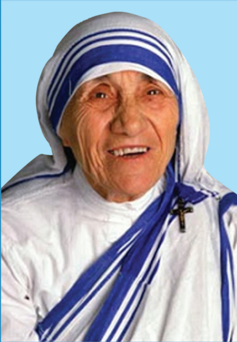
വിശുദ്ധ പദവിയിലേയ്ക്ക് 04-09-2016