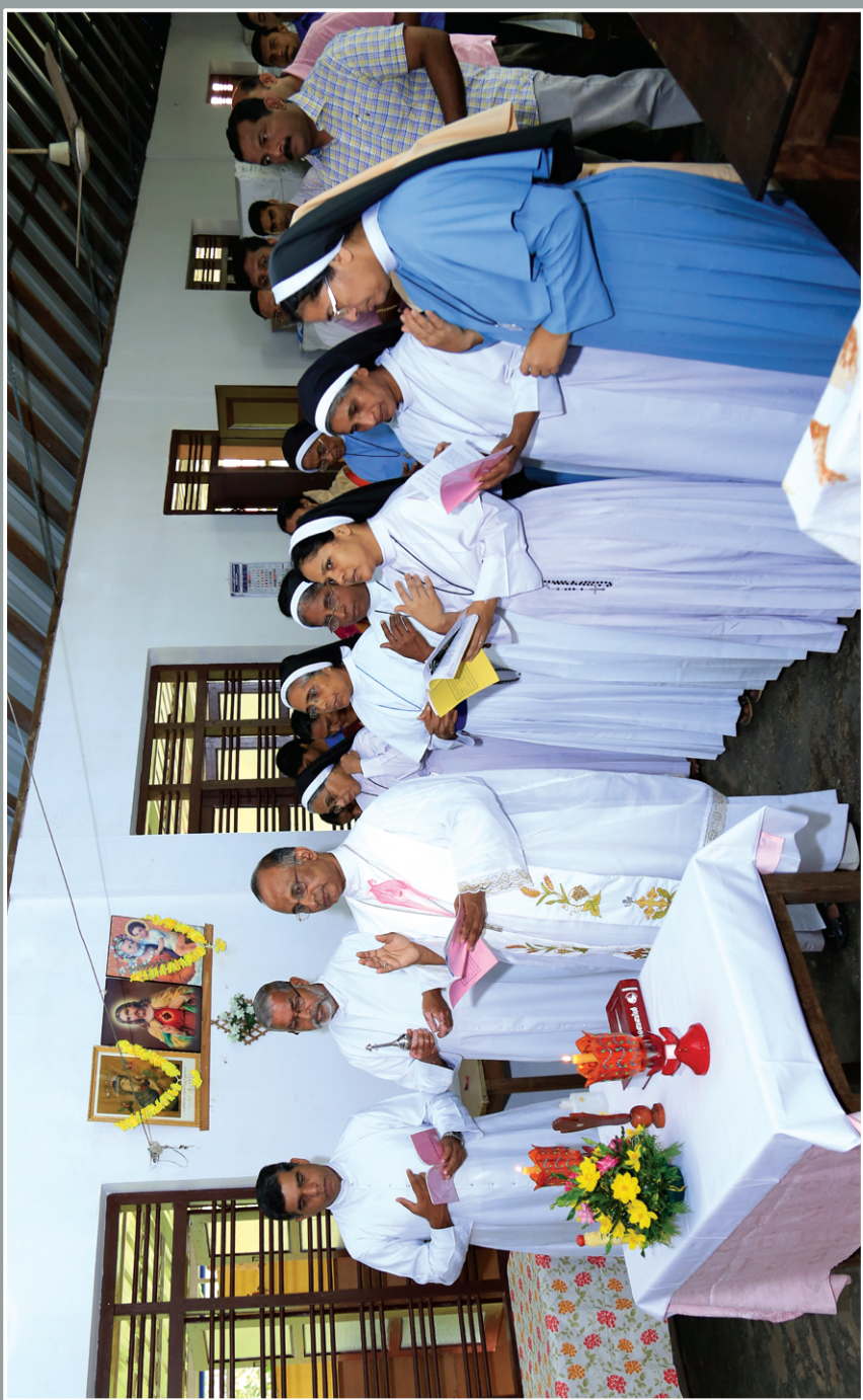
ജീവ ബുക്ക്സിന്റെ ഉദ്ഘാടനം അഭിവന്ദ്യ മാർ ജോർജ്ജ് മഠത്തിക്കണ്ടത്തിൽ പീതാവ് നിർവഹിക്കുന്നു.