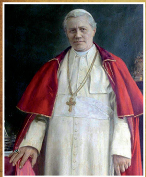
St. Pius X