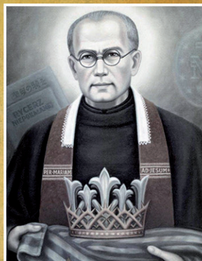
St. Maximilian Kolbe