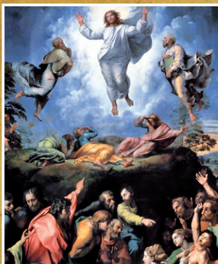
Transfiguration of Christ