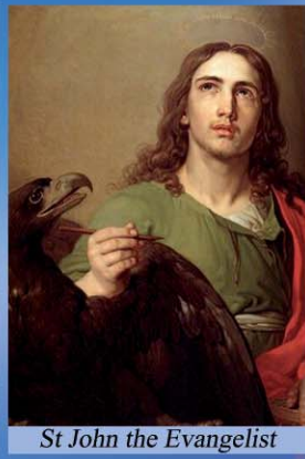
St John the Evangelist