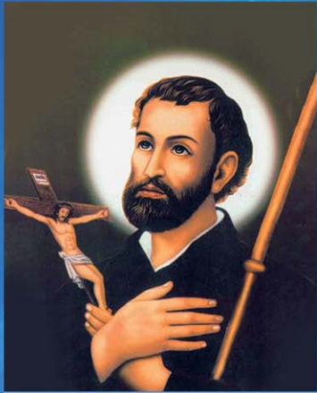
St Francis Xavier