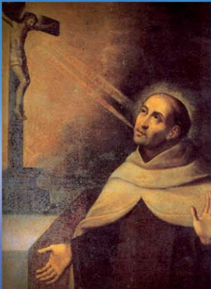
St John of the cross